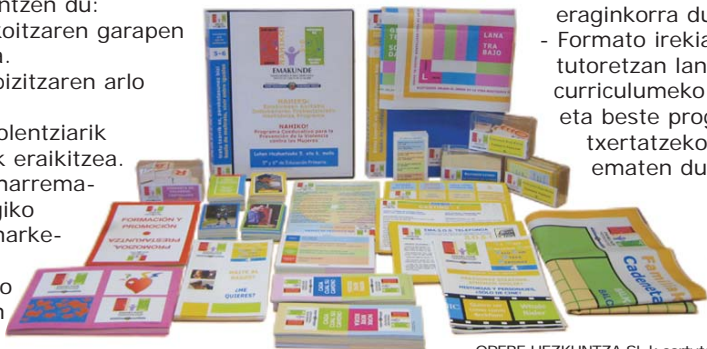
OREBE HEZKUNTZA SL-k sortutako materiala.